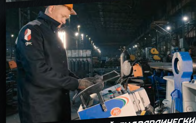
4-Х ВАЛКОВЫЙ ГИДРАВЛИЧЕСКИЙ ГИБОЧНЫЙ СТАНОК МГ С ЧПУ (ИТАЛИЯ)